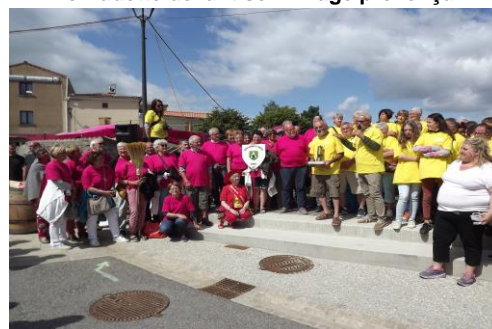
Remise de la flamme à St Romain La Motte

Les bénévoles se sont retrouvés pour faire le bilan et envisager la suite, vendredi 29 septembre à la salle des sapins. Le bilan financier présenté par la Vice-Présidente de l'association fait état d'un bénéfice de 1 876 € pour un budget total de 26 739 €. Si l'on ajoute les bénéfices récoltés lors des animations précédentes (réveillon, carnaval, fête des épouvantails, course de trottinettes, bourse aux jouets, concours de belote et de pétanque...), la trésorerie de l'association Air et Tourisme – la Romanaise atteint environ 10 000 €, permettant d'envisager la participation des Lerpsois aux prochaines Romanaises, et d'organiser d'autres rendez-vous conviviaux de toute la population.