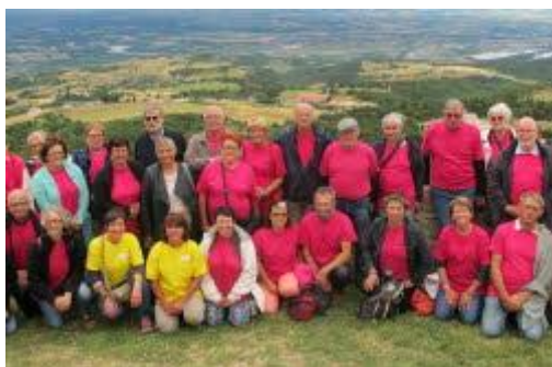
Nos amis de St Romain le Puy

Nous tenons à remercier très chaleureusement tous les bénévoles, qui se sont engagés nombreux, les sponsors et partenaires, qui nous ont accordé leur confiance, les associations qui nous ont apporté leur soutien, les écoliers et leurs enseignants pour leur interprétation de la chanson de Saint Romain de Lerps, les exposants venus expliquer leur savoir-faire, tous ceux qui ont animé l'accueil, la soirée et le défilé, les personnes qui ont gracieusement ouvert leur porte aux visiteurs, et bien sûr nos amis des Saint Romain de France, et tous ceux qui ont pris part à notre fête.