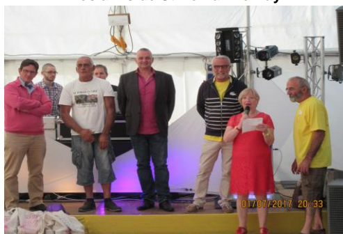
Soirée de Gala